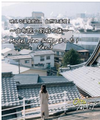
暖かな温泉街と、自然の絶景! ～由布院・別府の旅～ Model plan 公開しました! Ver.3