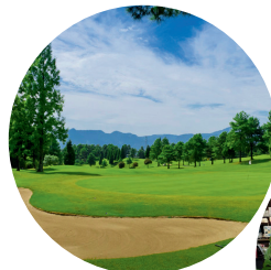
別府の森ゴルフ倶楽部

「おんせん県PRESS」の情報は、ツーリズムおおいたビジネスサイトでもご覧いただけます。また、「おんせん県PRESS」に掲載する情報も随時受付けておりますので、旅行会社様等に発信したい情報がありましたら、担当までご連絡ください。