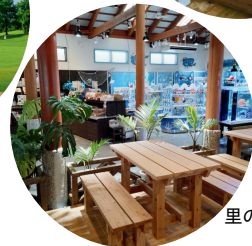
里の駅 つくみマルシェ