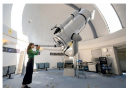
梅園の里天文台 天球館

大分県内各地の魅力スポットをお届けする大分県観光情報季刊誌「ぐるり秋号 vol.79」を発行しました。