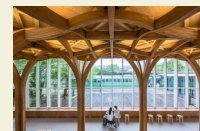
由布市ツーリスト インフォメーションセンター