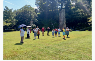
大分県内観光消費動向

また、講師を務めたあやめガイドが実施したミニミュージカルショーにより大いに会場を盛り上げました。